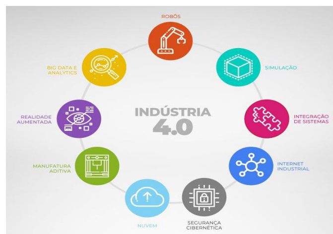
Figura 2 Pilares da indústria 4.0

A quarta revolução industrial é marcada pela convergência das tecnologias físicas, digitais e biológicas, englobando as principais inovações dos mercados de automação e controle e tecnologia da informação, aplicadas nos mais diversos segmentos do mercado. As organizações controlam os seus processos através de sistemas ciberfísicos e com a internet das coisas, tornando-os mais eficientes, autônomos e customizáveis.